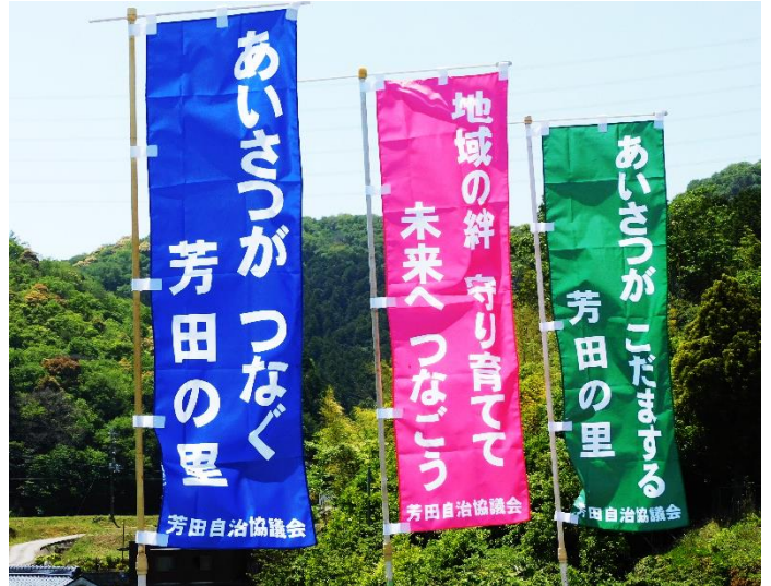
あいさつ標語ののぼり旗

芳田自治協議会がめざしている「絆を深める」第一歩はあいさつから始まります。これまでいろいろな場面であいさつをされてきたと思いますが、のぼり旗を見られましたら、みんなで元気なあいさつを芳田中に響かせましょう。特に登下校している子どもたちに積極的に声をかけてください。それは芳田地区のみんなで子どもたちを見守ることにもつながります。